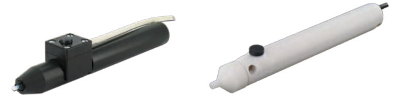
Dosiergriffel mit Fingerschalter und Spannutter im Lieferumfang enthalten 560989-B-V